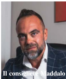
Il consigliere Maddalo