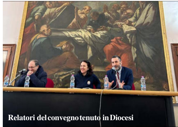
Relatori del convegno tenuti in Diocesi